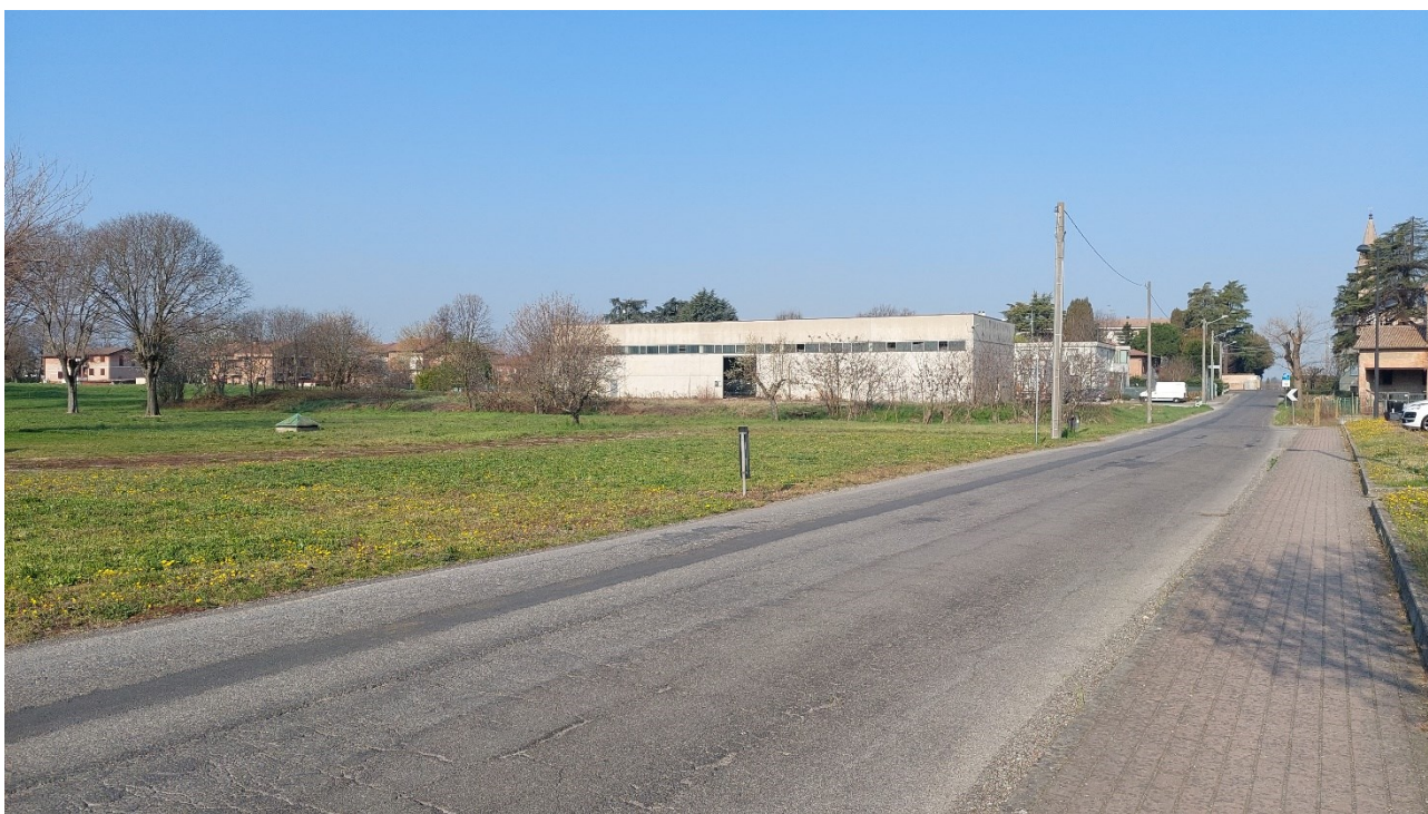
2 - Vista da nord-est dell'area da via San Giovanni Bosco