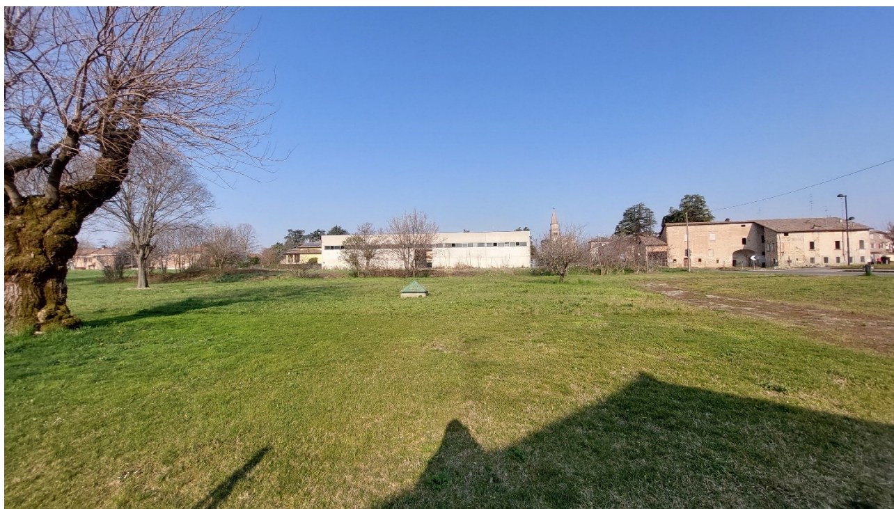
4 - Vista da est dell'area