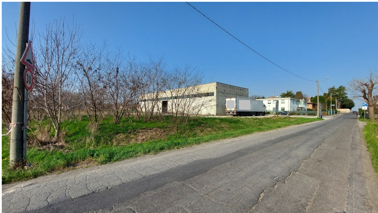
3 - Vista da nord-est ravvicinata dell'area da via San Giovanni Bosco