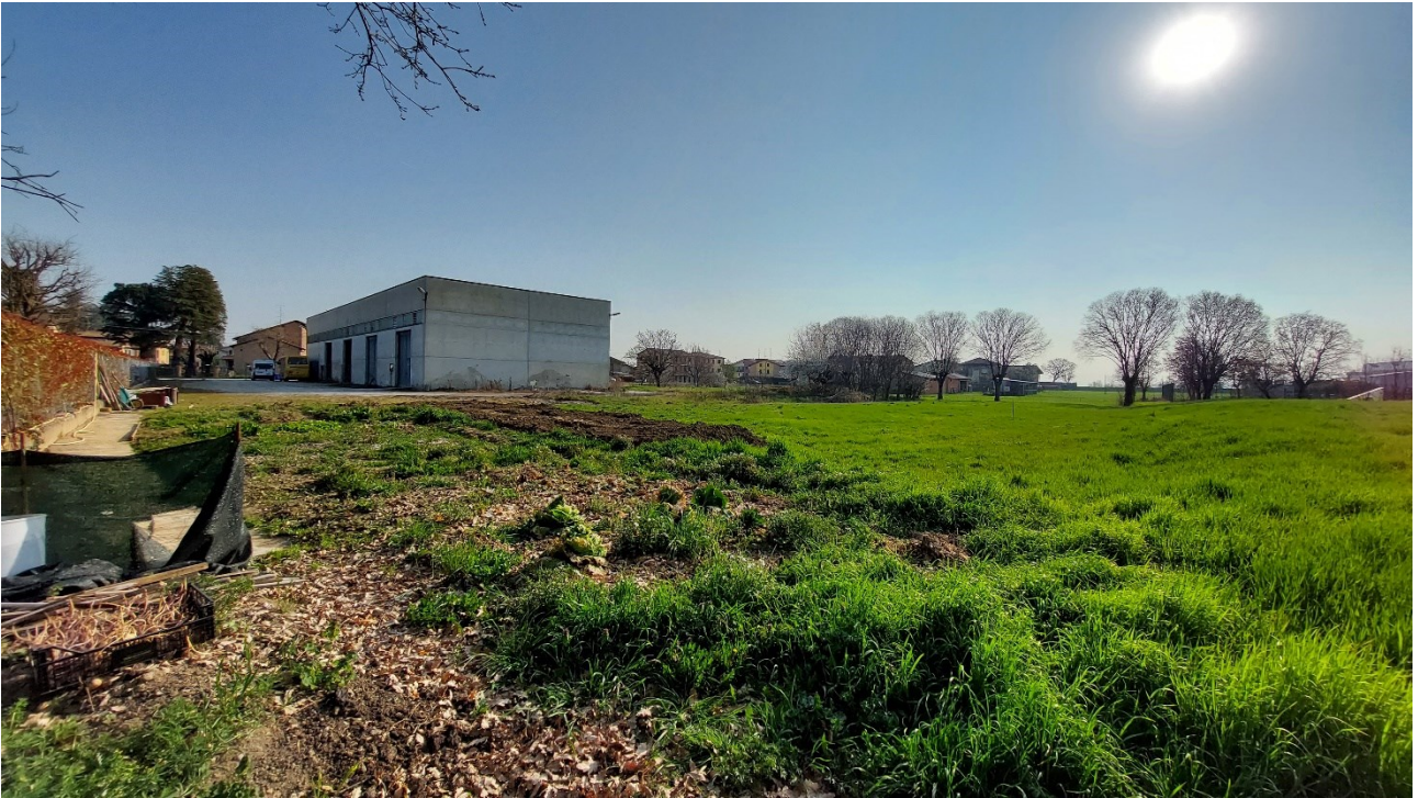
7 - Vista sud-ovest dell'area