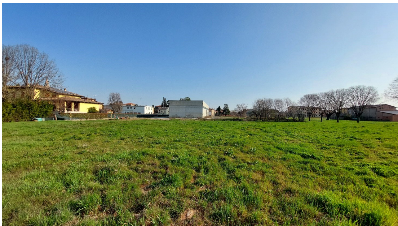
6 - Vista sud dell'area