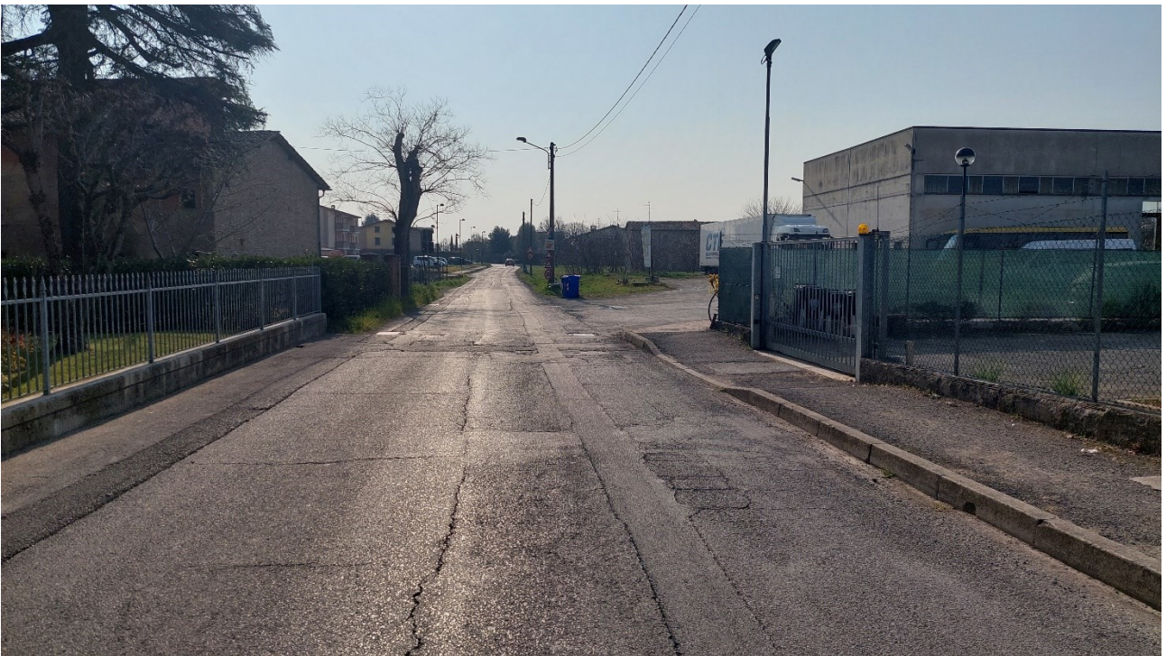
12 - Vista da ovest di via San Giovanni Bosco