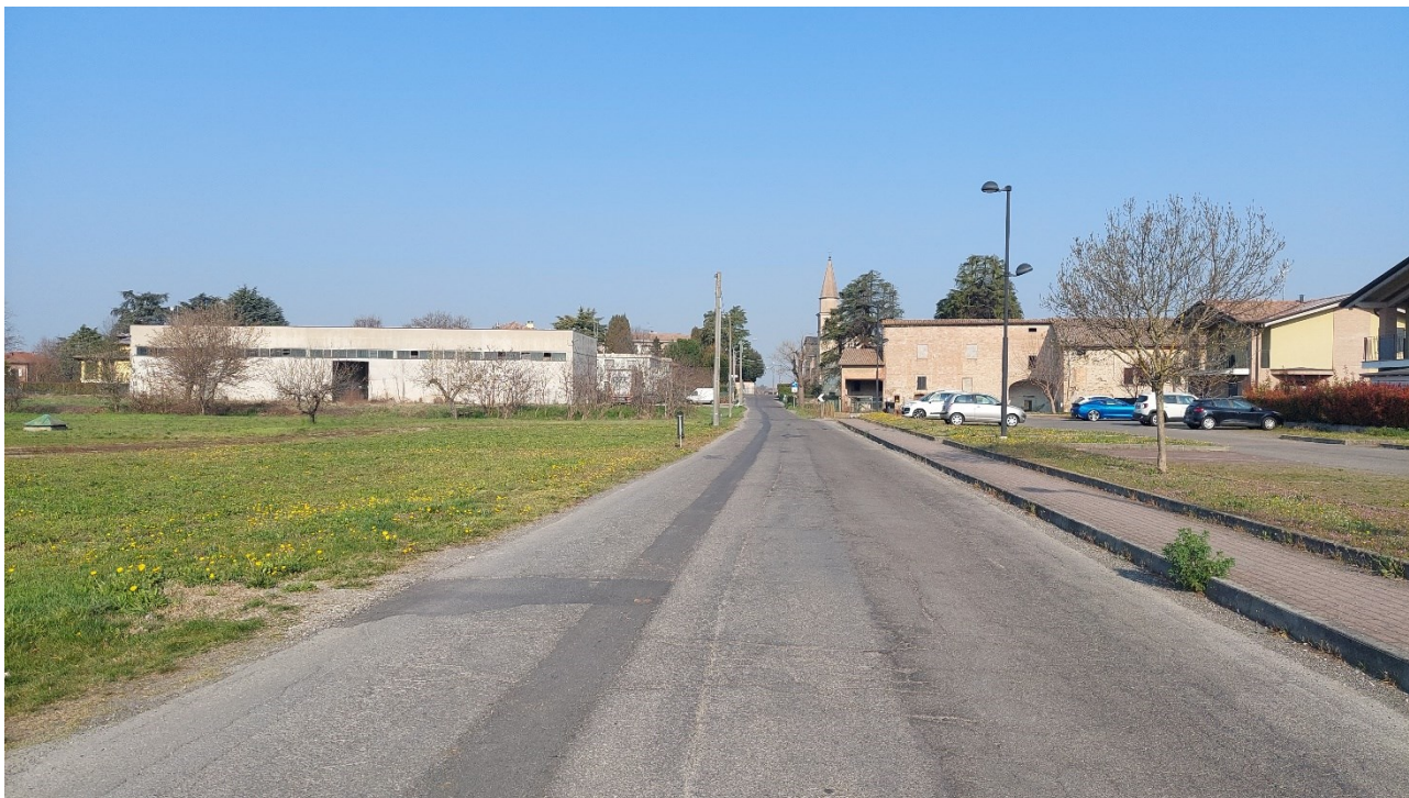
1 - Vista da est via San Giovanni Bosco