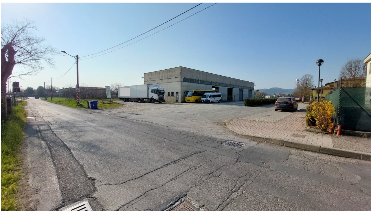
10 - Vista da nord-ovest dell'area