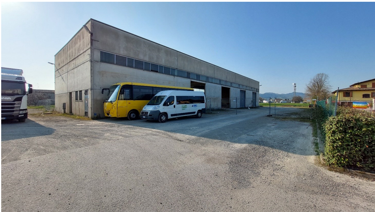
9 - Vista nord-ovest dell'ex magazzino comunale