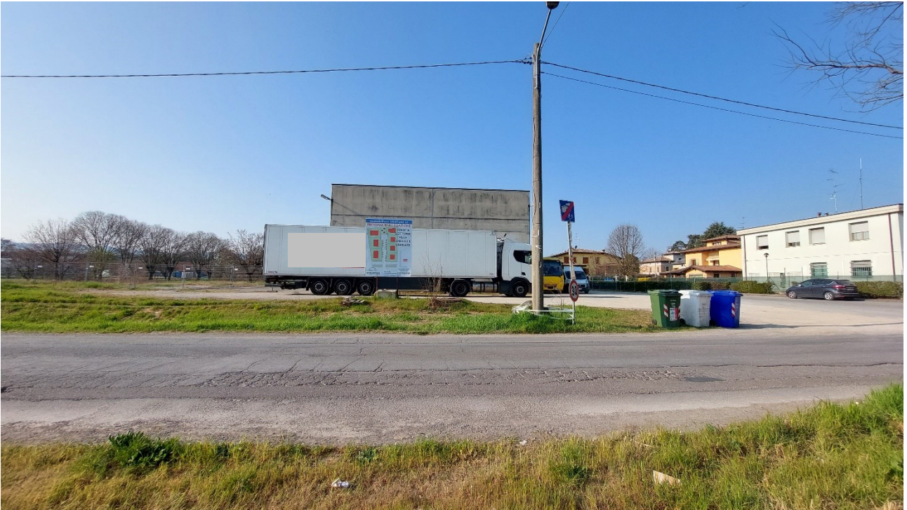
11 - Vista da nord dell'area