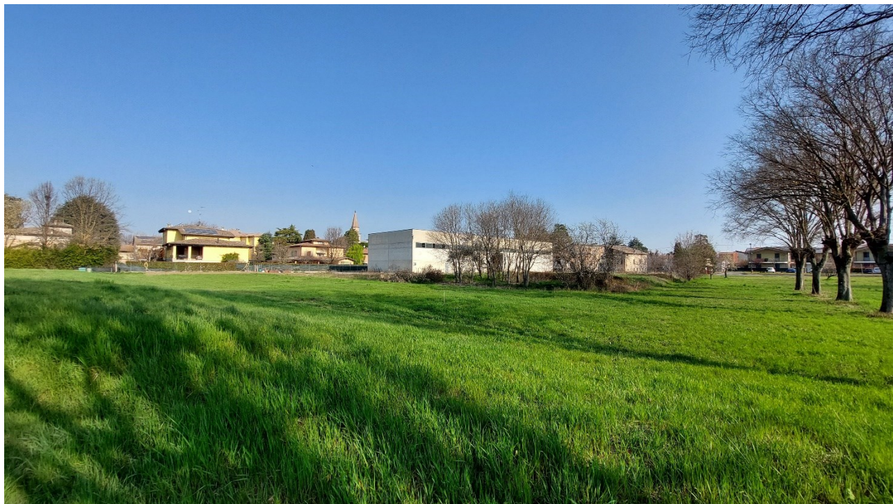
5 - Vista da sud-est dell'area