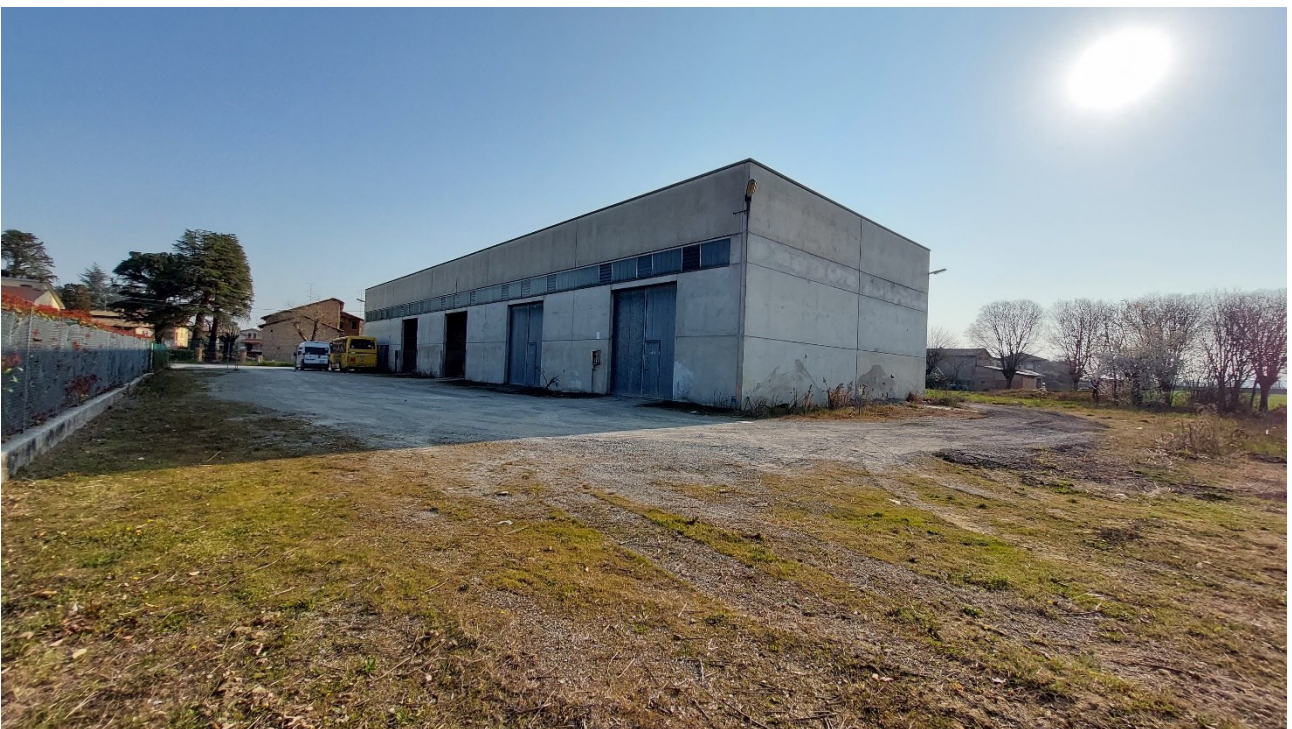
8 - Vista sud-ovest dell'ex magazzino comunale